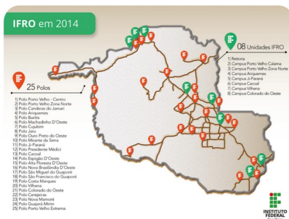
Figura 01 - Distribuição territorial das unidades do IFRO, em 2014