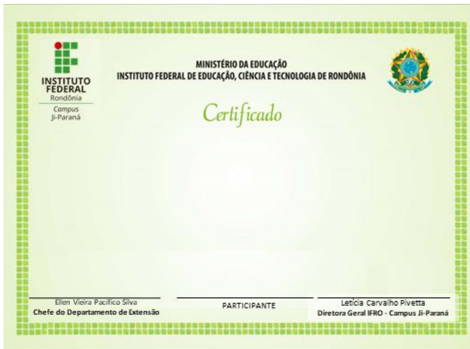
Figura 4 - Modelo do Certificado - Verso e Anverso