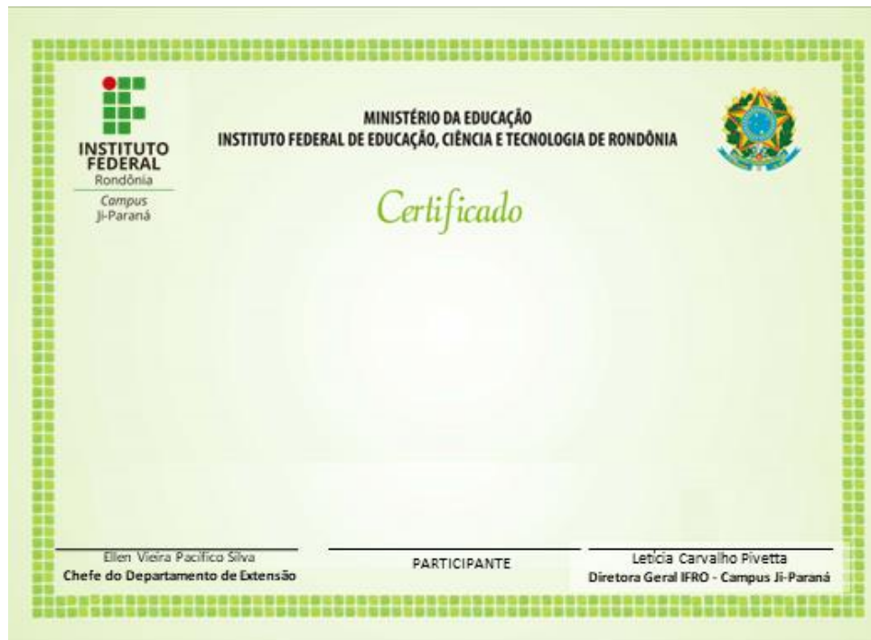
Figura 4 - Modelo do Certificado - Verso e Anverso