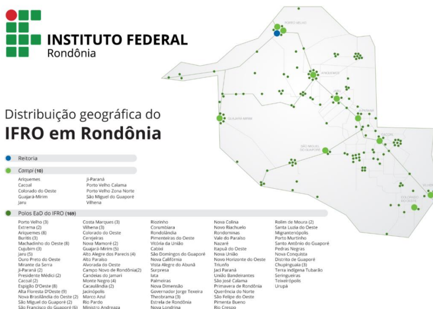
Figura 2 - Distribuição Geográfica do IFRO

O IFRO é administrado pela Reitoria e pela Direção Geral dos nove campi existentes em: Ariquemes, Cacoal, Colorado do Oeste, Guajará-Mirim, Jaru, Ji-Paraná, Porto Velho Calama, Porto Velho Zona Norte e Vilhena, com apoio dos órgãos colegiados, conforme a estrutura organizacional, especificada na Resolução nº 65/CONSUP/IFRO/2015 e demonstrada na figura abaixo: