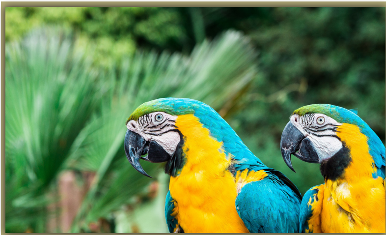
Foto 7 - Araras.

Os pequenos animais como pássaros, morcegos e macacos ajudam a dispersar sementes que se tornarão novas árvores.