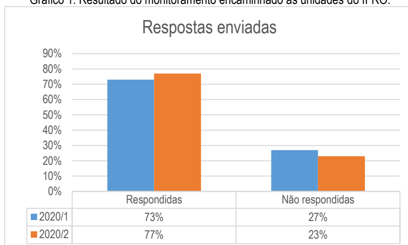
Gráfico 1: Resultado do monitoramento encaminhado às unidades do IFRO.