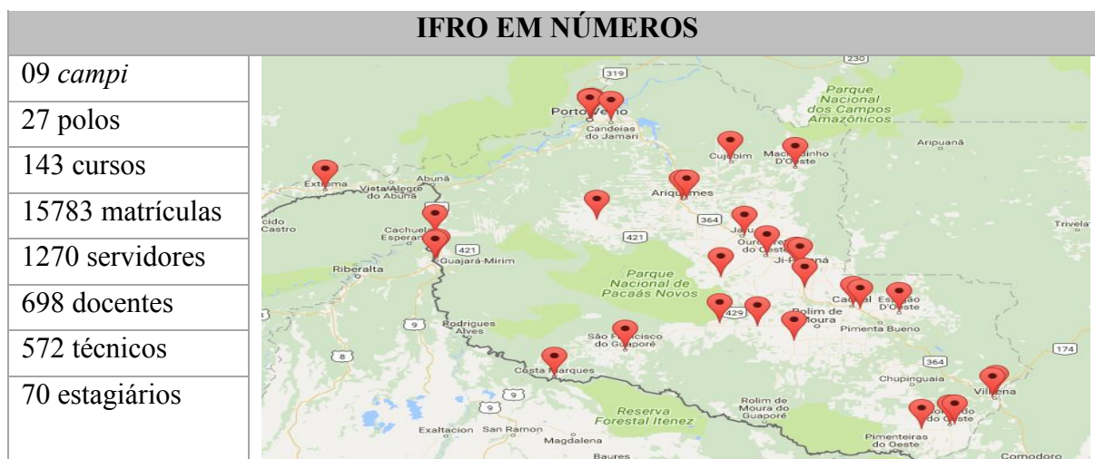
Quadro 1 - Instituto Federal de Rondônia