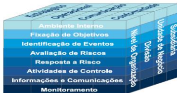
Figura 1 – Matriz Tridimensional - Componentes do Gerenciamento de Riscos

O modelo é representado no formato de uma matriz tridimensional, demonstrando a integração dos elementos que o compõem, conhecido como CUBO COSO II.