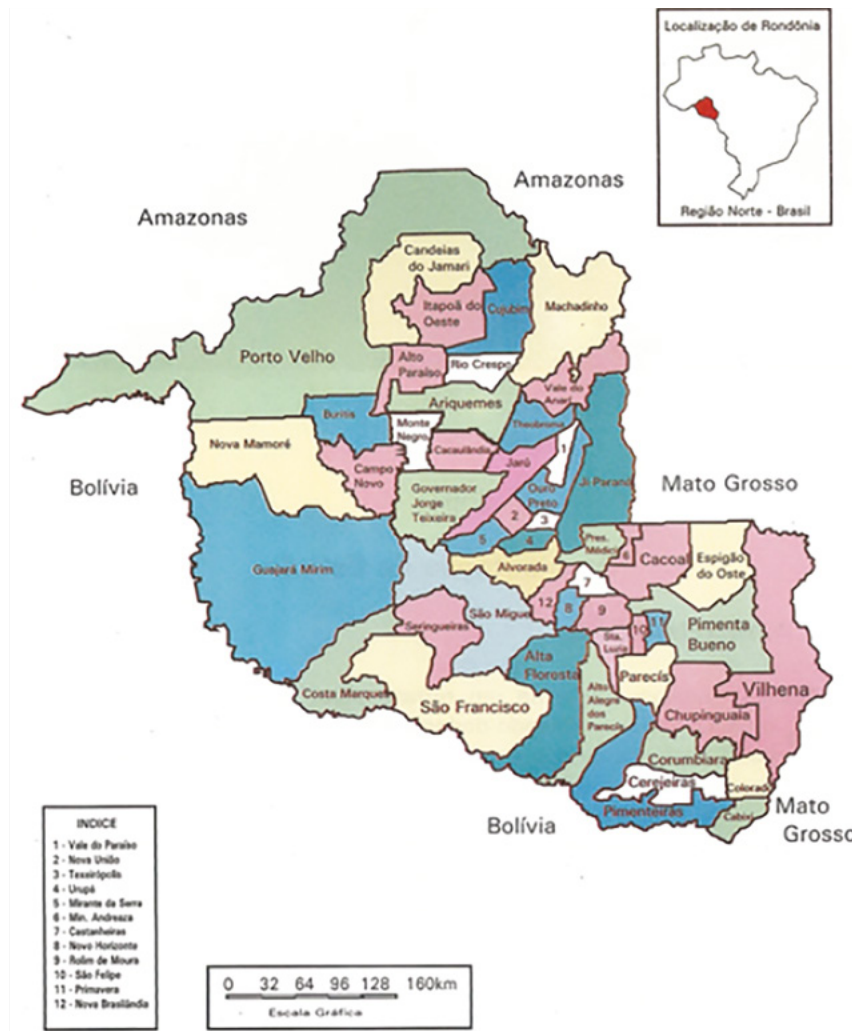
Figura 06 - Mapa de Rondônia Fonte: Fiero (2003, p. 18) 8

7 RONDÔNIA. Secretaria de Estado do Desenvolvimento Ambiental. Zoneamento Socioeconômico-Ecológico do Estado de Rondônia : planejamento para o desenvolvimento sustentável e proteção ambiental. Porto Velho: Sedam, 2010. 8 FIERO. Rondônia: Perfil socioeconômico industrial 2003. Porto Velho: Fiero, 2003.